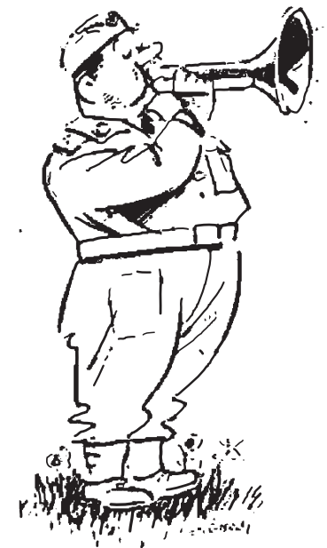
Menig 66 blæser honnør